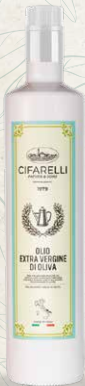
Bottiglia di vetro Formati: 750 ml

Olio extra vergine di oliva di categoria superiore, ottenuto direttamente da olive monocultivar coratina mediante procedimenti meccanici. Estratto a freddo. Prodotto esclusivamente con olive raccolte negli oliveti di famiglia e molite nella stessa giornata della loro raccolta.