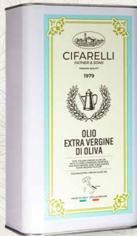
Lattina di alluminio Formati: 3 lt / 5 lt